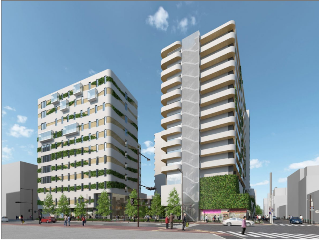
那の津通り側外観