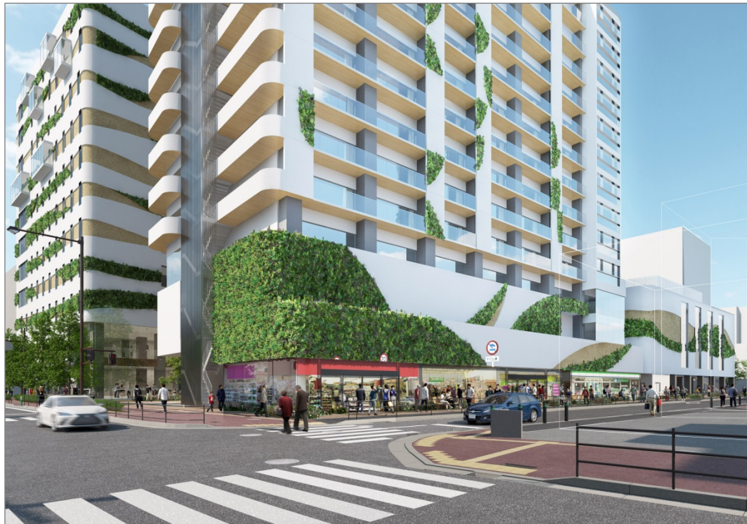
那の津通り側外観（アイレベル）